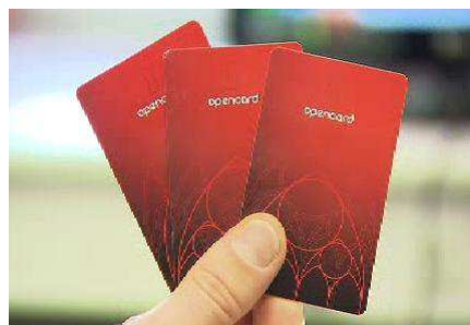
Obr. 2. karta Pražana