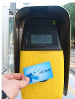
Obr. 1. Andante karta

Inspirací pro princip fungování komunitní měny byly především systémy postavené na využívání multifunkčních čipových karet s možností rozšiřování jejich funkčnosti díky nahrávání dalších aplikací. Takovéto karty lze využívat jako peněženku, jízdenku na městskou hromadnou dopravu, či vstupenku do vybraných institucí jako jsou muzea či zoologické zahrady. Jedná se proto o komfortní a univerzální nástroj uplatnitelný v běžném životě. Takovéto karty a systémy se využívají v řadě měst na světě, například v Portu je to karta Andante, či v Praze karta Pražana tzv. Opencard.