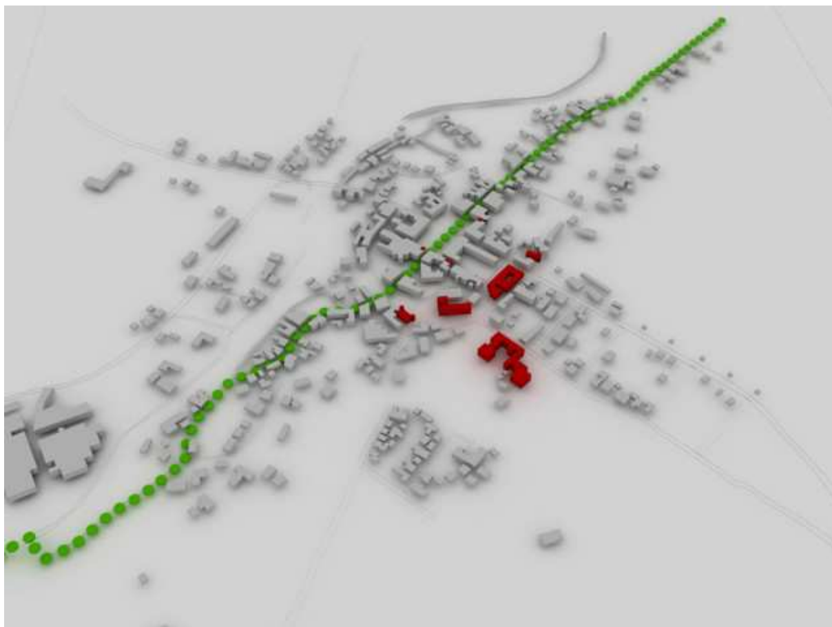
Obr. 6 Model města převedený do 3D