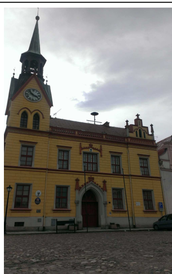
Obr. 1 Radnice ve Vidnavě

Povolení k výstavbě semináře dostal vratislavský biskup Georg Kopp. Budova byla dána do užívání v roce 1902.