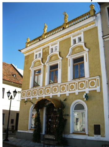
Obr. 3 Lékárna u černého orla