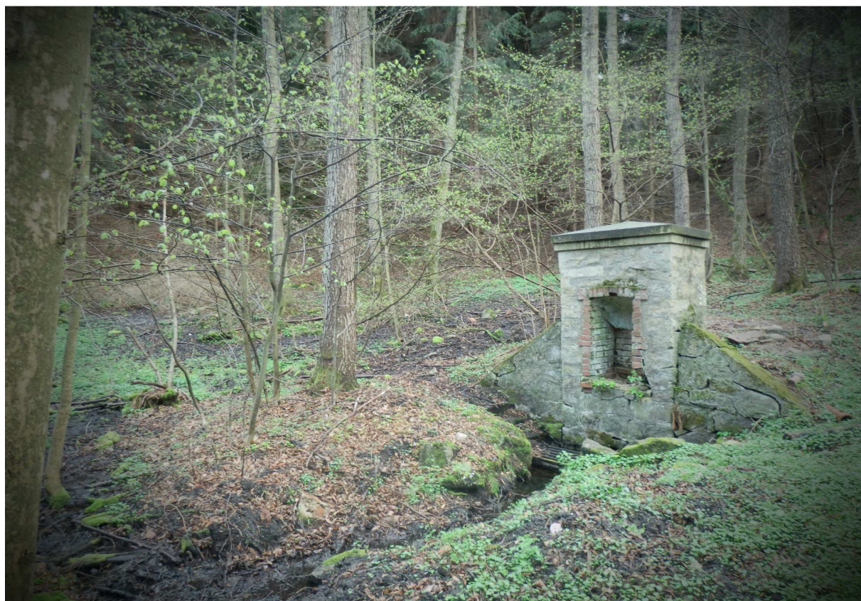
Obr. 9 Současný stav pramene nedaleko hrobky rodiny Latzelovy

Součástí vybudování naučné stezky by byla i kompletní rekonstrukce kaple a hrobky rodiny Latzelovy nacházející se nedaleko od lomu. Vedle kaple se nachází také zanedbaný pramen a zrušená křížová cesta. Vše by v rámci projektu bylo obnoveno a na informačním panelu by byly také kompletní informace o těchto památkách a informace o rekonstrukci. Byla by zde také větší lavička se stolem pro odpočinek.