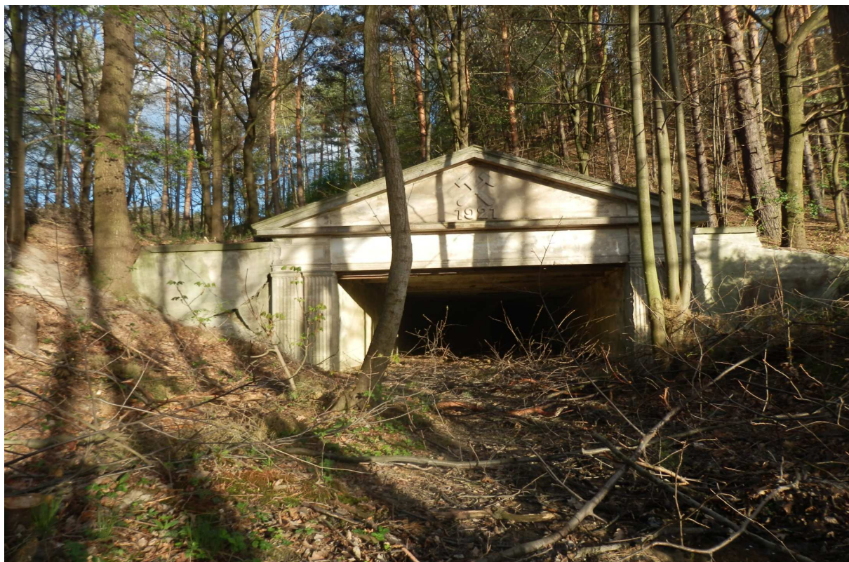
Obr. 8 Portál tunelu do bývalého kaolinového lomu v současném stavu

Panel se bude nacházet t na začátku tunelu bývalé úzkorozchodné dráhy do bývalého kaolinového lomu. Návštěvníci se seznámí s historií tohoto dobývacího místa. Atraktivitou, která by mohla nalákat návštěvníky je, že trasa vede právě tunelem, kudy také vedly koleje do lomu. Na konci tunelu se kromě východu nachází také koutek, kde se pravděpodobně otáčely vozy. Zde v koncové části by byla vytovřekná malá kaple sv. Ambrože, patrona včelařů. Odtud by trasa vedla po zajištěném povalovém chodníku z tunelu přes lom dále.