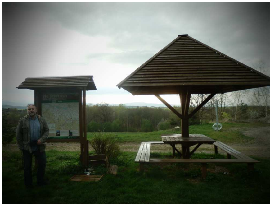
Obr. 10 Současný stav altánku u obce Laka

Panel by byl umístěn u odpočinkového altánku na vyhlídkovém místě. Byla by zde i panoramatická fotografie s označením vrcholů Hrubého Jeseníku a Rychlebských hor. Zde by se napojovala i cyklotrasa velké Kraše do Otmuchowa. Byla by zde i významová odbočka stezky do PR Vidnavské mokřiny.