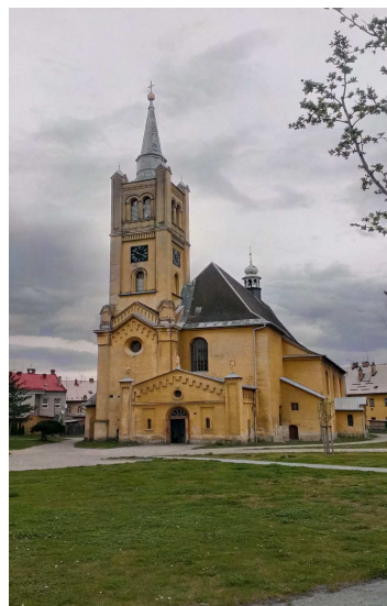
Obr. 2 Kostel sv. Kateřiny